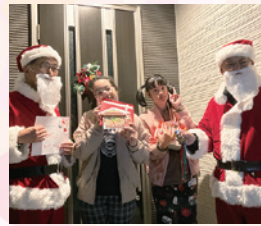
在宅障がい児へボランティアがクリスマスケーキを届けるイベント