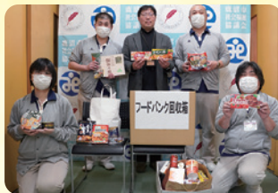
老人保健施設かみつが ご利用者ご家族様と職員様