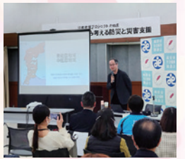
能登半島地震から考える防災と災害支援講演会の様子