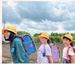
新一年生への黄色い帽子の贈呈