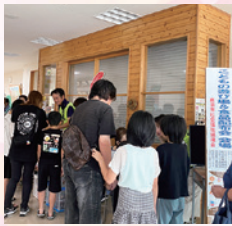
食品配布会の様子