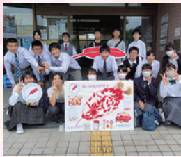
街頭募金に協力してくれた中高生