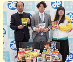
明治安田生命保険相互会社 宇都宮支社 鹿沼営業所 様

その他、匿名での寄附やフードバンクも多数お預かりしました。ありがとうございました。