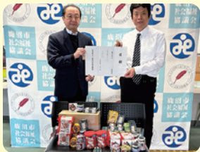
株式会社 ダイナム 様