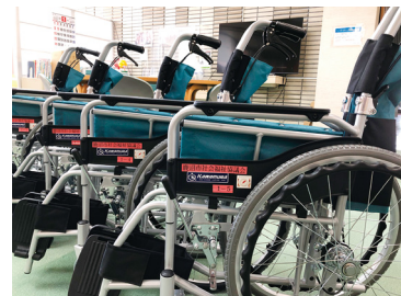
貸出機材として、車いすを新調。 福祉教育にも活用します