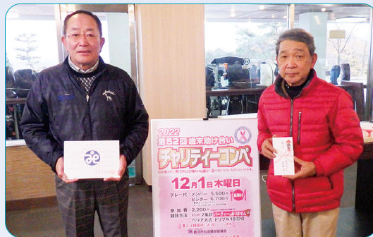
鹿沼72カントリークラブ 歳末助け合いチャリティーコンペ 様