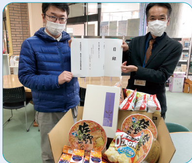
(株)ダイナム 栃木鹿沼店 様

その他、匿名での寄附やフードバンクも多数お預かりしました。ありがとうございました。