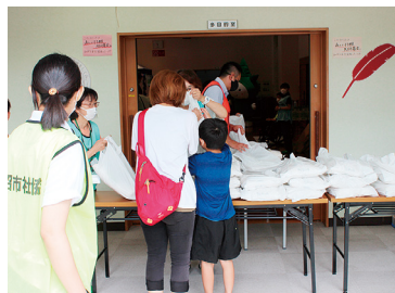
お米を配布するイベント