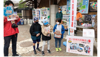
ボーイスカウトの皆さんによる街頭募金