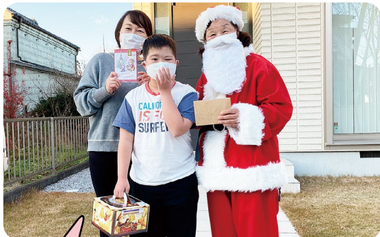
在宅障がい児へボランティアがクリスマスケーキを届けるイベント