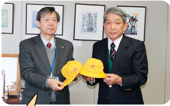
小学校新1年生へ黄色い帽子を寄附