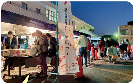
カレーの炊き出しイベント開催