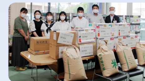
鹿沼高校家庭クラブ 様