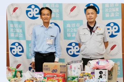
株式会社LIXILトータルサービス栃木拠点 様