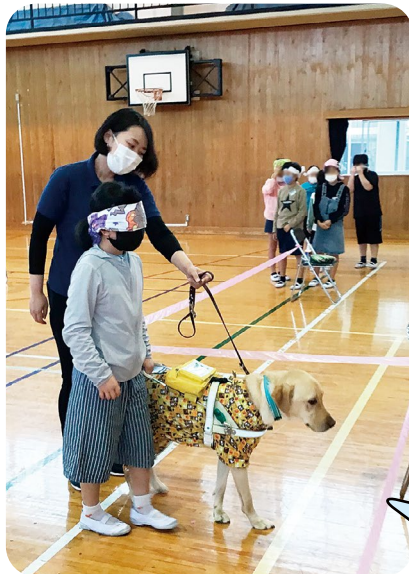
小学校での盲導犬体験への助成