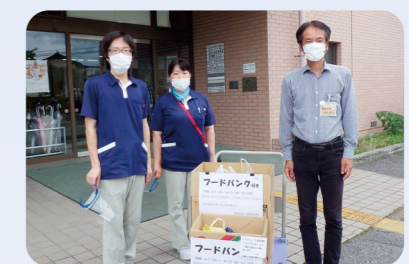
老人保健施設 かみつが 様