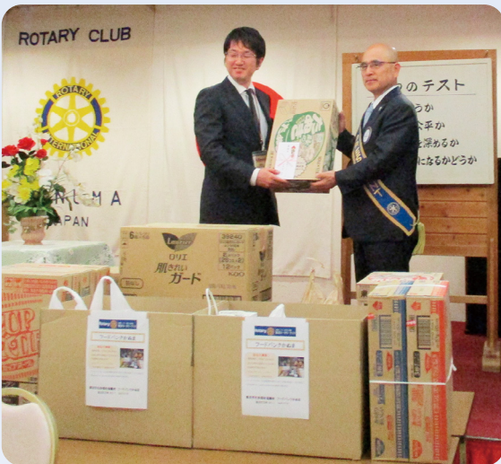
鹿沼ロータリークラブ 様