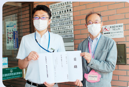
(株)ダイナム 栃木鹿沼店 様