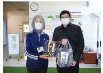
手づくりショコラ工房アカリチョコレート 様