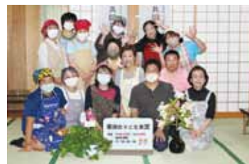
(活用例) 子ども食堂の支援