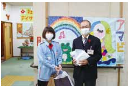
東京電力常備労働組合 様