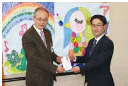
鹿沼市職員労働組合 様