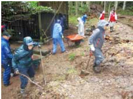
林道に流入した土砂の除去