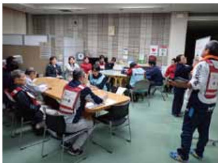
1日の振り返りミーティング