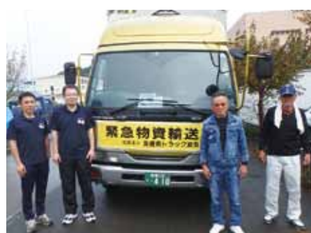
愛媛県西予市から資材の提供