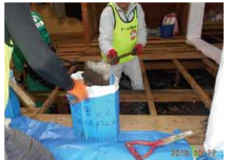
床下から土砂の除去