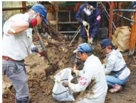
泥を土のう袋に入れる