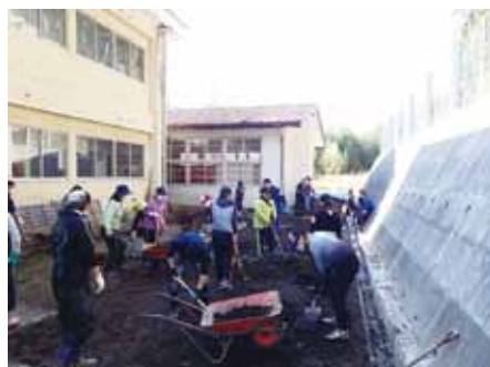
粕尾小学校校舎の裏側