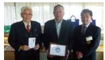
第49回歳末助け合いチャリティコンペ(72カントリークラブ)様