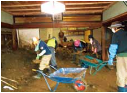
家屋内の土砂の除去