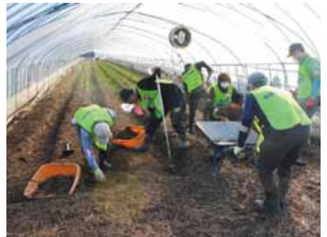
ビニールハウス内の活動