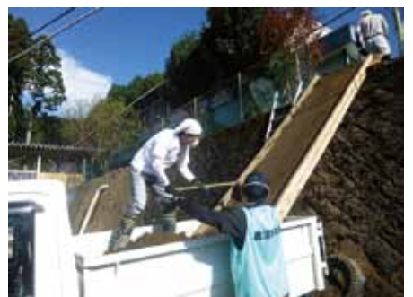
粕尾小学校での活動