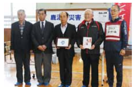
中・入粟野むらづくり推進協議会様