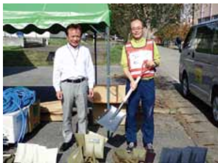
足立区社協より資材の提供