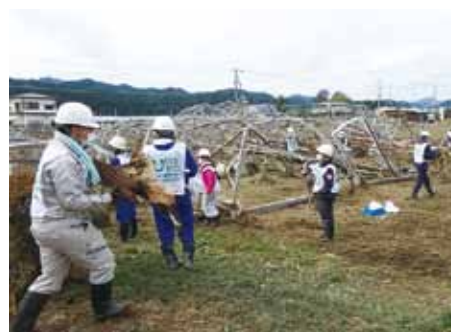
たくさんの団体が参加してくれました