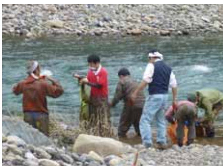
断水中は川で道具を洗いました