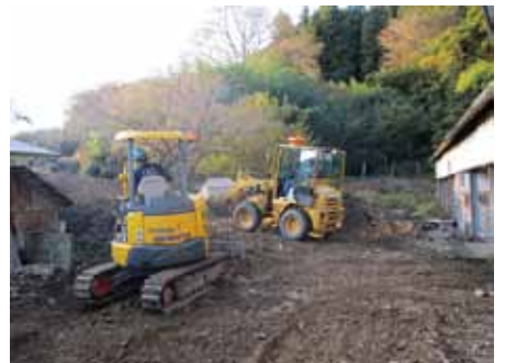
建機を使っでの活動