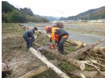
チェーンソーによる活動