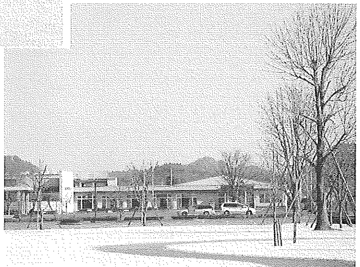
鹿沼市高齢者福祉センター（酒野谷）→ （老人福祉センター） 【指定管理運営受託】