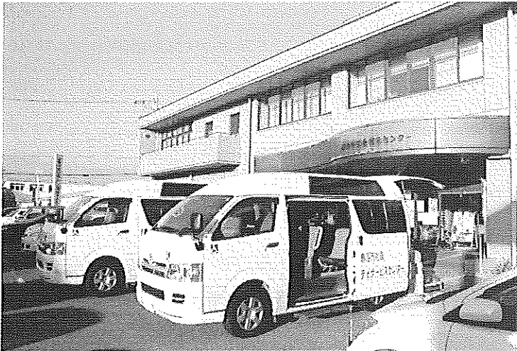
←鹿沼市総合福祉センター（万町） 【社協本部】