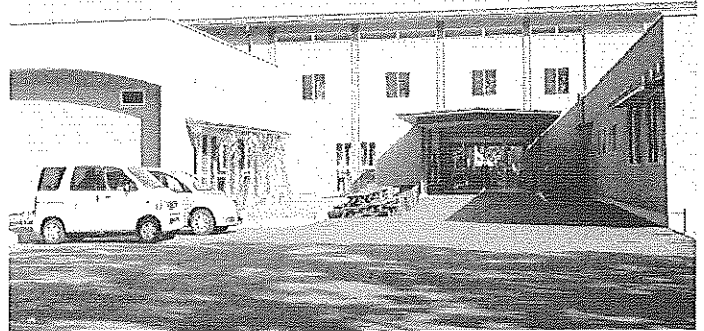
鹿沼市千寿荘（日吉町）→ （養護老人ホーム） 【指定管理運営受託】